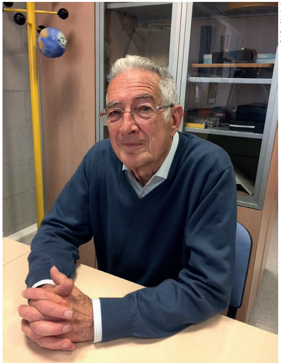
Font: Consell de redacció

Un dels factors que distingeixen les diverses aplicacions són les escales i els canvis d'escala. Les escales cartogràfiques es mouen des de les més petites, com ara 1:40.000.000 per a una bola del món de sobretaula, fins a les més grans, com 1:25.000 i 1:10.000 pròpies de mapes topogràfics i d'urbanisme, o 1:50 dels arquitectes. En síntesi, un gradient d'escales tan diferents implica que els processos de generalització —conceptualització, simplificació, esquematització, estructuració— han de ser també molt diferents per a les diverses aplicacions. Per exemple, el turista treballa amb unes escales